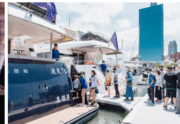
船艇搭乘體驗活動