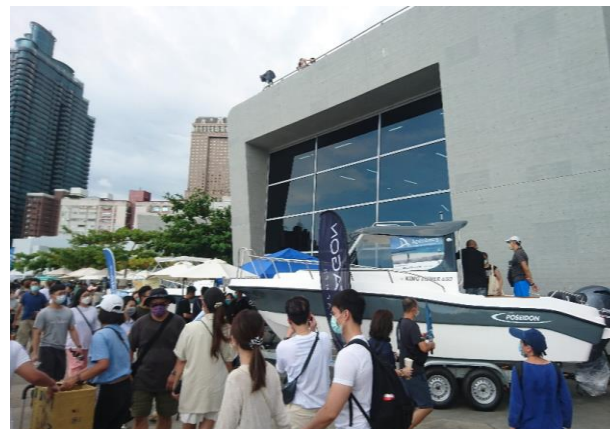
海洋派對遊艇產業展覽(陸域)