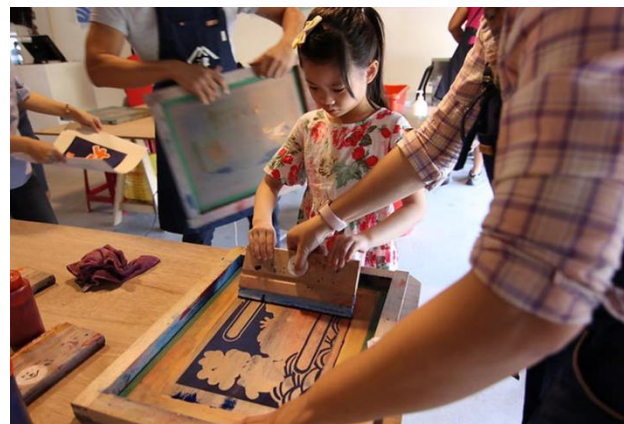
大漁旗文化復興 「山津塢」漁旗絹印製作