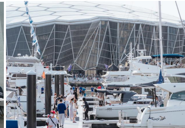
海洋派對遊艇產業展覽(水域)